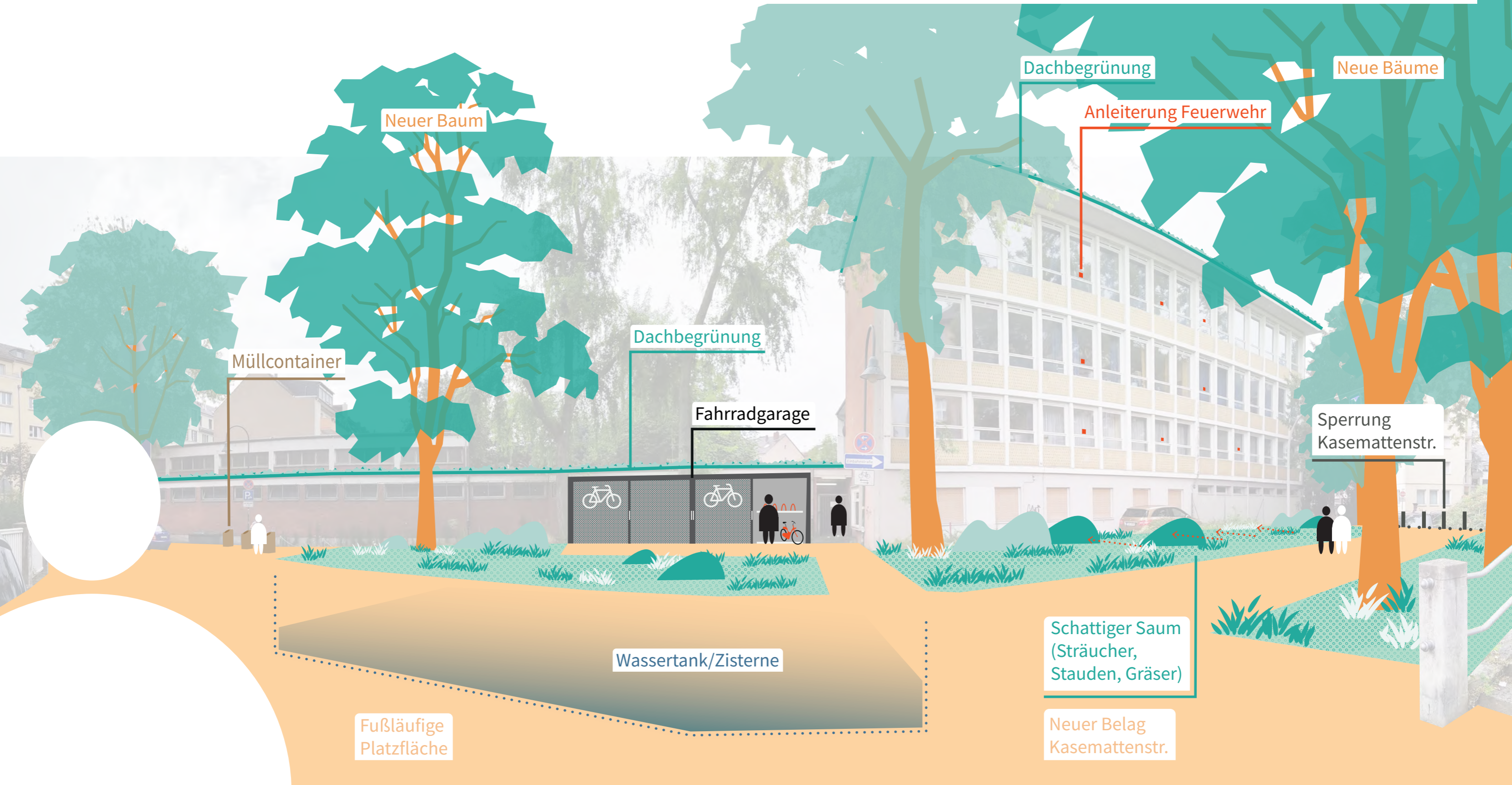
Blick aus der Straße Von-Sandt-Platz in Richtung Schulgrundstück/Kasemattenstraße

Hinweis: Die Darstellung zeigt eine Sammlung von Akteursideen entstanden im Rahmen der lokalen Aktionsgruppe Überflutungsvorsorge am 19.06.2020. Die Zeichnung ist kein fertiger Entwurf. Vielmehr möchten wir mit ihr die gemeinsame Ideenentwicklung für die Kasemattenstraße weiterführen.